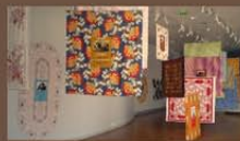
Exposition d'oeuvres d'art, les espiègleries culinaires, avec Transigum.