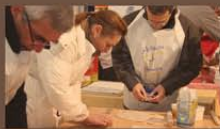
Atelier culinaire avec la Fédération des boulangers du Bas-Rhin.