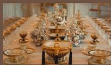
Exposition Arts de la Table Porcelaine de Sèvres et cristallerie de Saint-Louis.