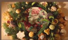
Atelier technique photo avec Etienne Heimermann.